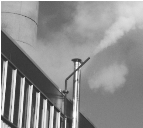
So sah es vor der Zeit der GEM Kondensatableiter aus