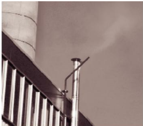
und so bei Verwendung von GEM Kondensatableitern